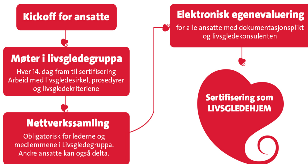
Figur 3: sertifiseringsforløp fra kickoff til sertifisering

I snitt tar det omtrent 1 – 1,5 år fra kickoff til første sertifisering. Deretter resertifiseres virksomheten årlig.