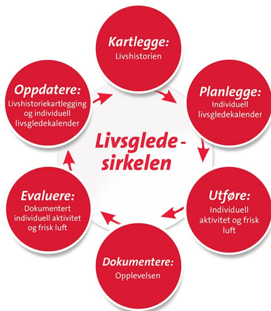
Figur 2: Livsgledesirkelen

For å skape livsglede for hver enkelt beboer, må man ha inngående kjennskap til deres livshistorie, interesser, hobbyer og funksjonsnivå. Primærkontaktene skal innhente en detaljert kartlegging av beboerne, og på bakgrunn av den lage individuelle livsgledekalendre med minimum en individuell aktivitet og et tilbud om å komme ut i frisk luft hver uke. Virksomheten skal ha systemer som sikrer at de planlagte tiltakene blir utført. Videre skal beboers opplevelse av tiltakene observeres og dokumenteres. Gir det faktisk livsglede?